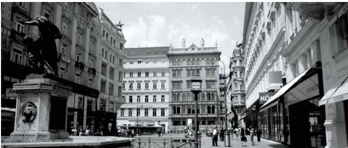
Kohlmarkt à Vienne, Autriche.

Avec G Croissance 2014, vous pouvez personnaliser votre investissement, la durée et la garantie en capital, selon vos projets et besoins.